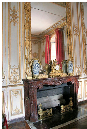
Cheminée du Cabinet Intérieur de Louis XV au Château de Versailles réalisée en marbre Rouge Griotte.

Largement exporté, les Etats-Unis ont particulièrement apprécié le raffinement de ce noble matériau.