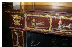
Détail de la cheminée conservée au Musée du Louvre.