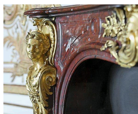
Cheminée conservée au Musée du Louvre à Paris réalisée en marbre Rouge Griotte et à ornements de bronze.