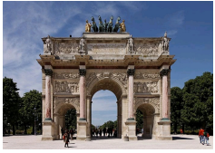
Arc de Triomphe du Carrousel, place du Carrousel, Paris.

Cheminée des petits appartements de Marie-Antoinette, installée ultérieurement dans la Chambre de Louis XV au Petit Trianon.