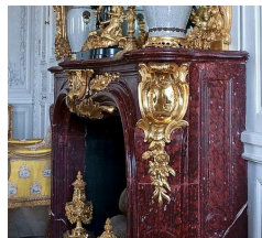
Cheminée de l'appartement de Madame Victoire, Château de Versailles.