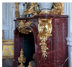
Cheminée de l'appartement de Madame Victoire, Château de Versailles.