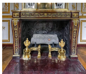
Cheminée de la Garde-robe de Louis XVI au Château de Versailles.