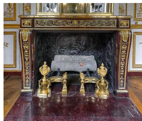
Cheminée de la Garde-robe de Louis XVI au Château de Versailles.