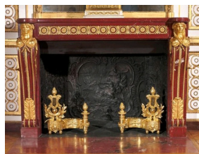
Cheminée du Cabinet Doré, Château de Versailles.