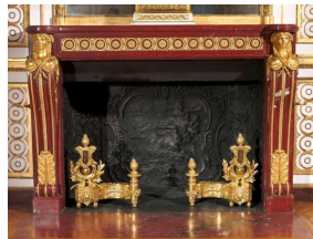
Cheminée du Cabinet Doré, Château de Versailles.