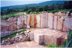
Carrière de Caunes-Minervois.

Cheminée du Salon de l'Hôtel Talairac conservée au Musée des Arts Décoratifs à Paris.