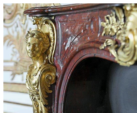
Cheminée conservée au Musée du Louvre à Paris réalisée en marbre Rouge Griotte et à ornements de bronze.