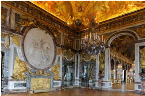
Le Salon de la Guerre du Château de Versailles