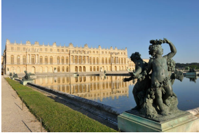
Le Château de Versailles vu du Parterre d'eau

Demeure fantasmée des rois de France, symbole du pouvoir monarchique, le château de Versailles suscite encore aujourd'hui enthousiasme et passion. Élément principal du domaine de Versailles, il s'étend sur 63.154m 2 en 2.300 pièces. A l'origine, un modeste château de chasse, surnommé le « chétif château de Versailles », avait été érigé par Louis XIII en 1623 puis agrandi en 1631. En 1669, son fils, Louis XIV entreprend un grand concours en vue de transformer le château initial en une demeure royale . C'est le point de départ d'agrandissements successifs menés par l'architecte Louis Le Vau puis Jules Hardouin-Mansart , sous la férule unificatrice de Charles Le Brun . Conçu comme un manifeste de la puissance économique et artistique de la France, il est également le siège de pouvoir et de l'absolutisme monarchique, envié et copié par la plupart des cours européennes. La Cour et le gouvernement s'y installe donc dès 1682, sur ordre de Louis XIV , et y demeure jusqu'à la Révolution.