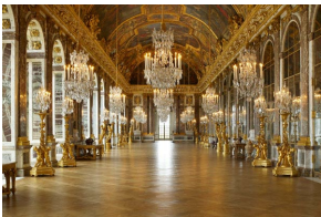
La Galerie des Glaces du Château de Versailles