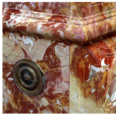
Détail d'une Brèche de Saint-Maximin