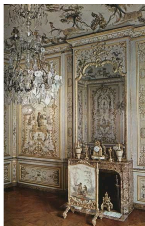
Château de Chantilly, cheminée en Brèche d'Alep, XVIII e