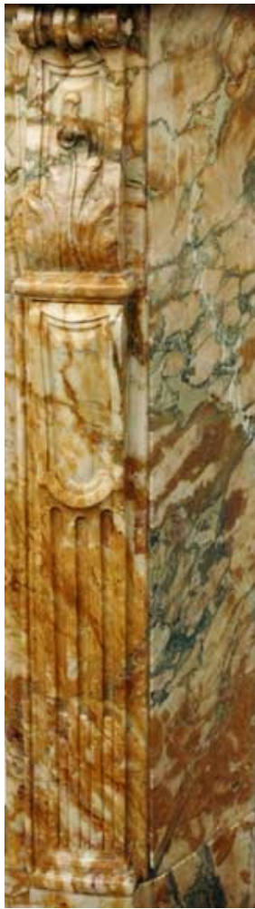
Détail d'une Brèche du Benou