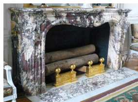
Grand Trianon de Versailles, cheminée en Brèche Violette, salon de famille de l'Empereur