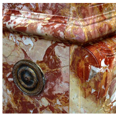
Détail d'une Brèche de Saint-Maximin