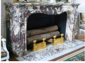
Grand Trianon de Versailles, cheminée en Brèche Violette, salon de famille de l'Empereur