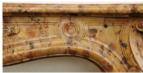
Détail d'une Brèche d'Alep