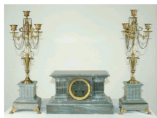
French Mantel Clock & Candelabrum Loan courtesy of the Hoffman Clock Museum, Newark, NY