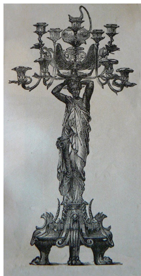
Gravure est extraite de The Illustrated Art Journal, Illustrated Catalogue of the International Exhibition, 1862, p. 199.