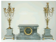
French Mantel Clock & Candelabras Loan courtesy of the Hoffman Clock Museum, Newark, NY