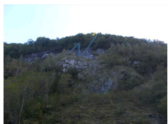
Carrière de marbre Vert d'Estours, Ariège.