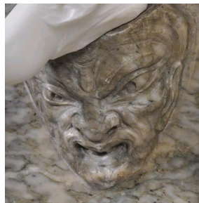
Détail de jardinière en marbre Vert d'Estours, Galerie Marc Maison.