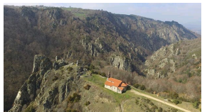
Notre-Dame d'Estours dans la vallée d'Estours, Ariège.