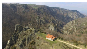
Notre-Dame d'Estours dans la vallée d'Estours, Ariège.