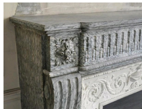
Cheminée de style Louis XVI en marbre Vert d'Estours, Galerie Marc Maison.