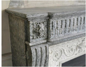
Cheminée de style Louis XVI en marbre Vert d'Estours, Galerie Marc Maison.