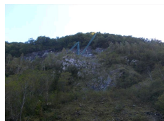
Carrière de marbre Vert d'Estours, Ariège.