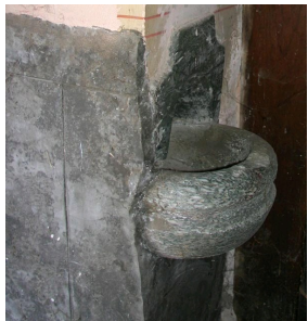
Bénitier de Notre-Dame de Pitié à Seix, Ariège.