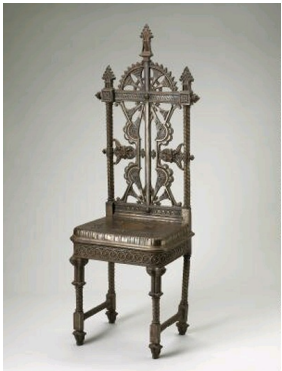
Christopher Dresser, Chaise en métal Minneapolis Institute of Arts