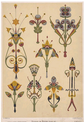
Planche VIII de Studies in Design - 1875