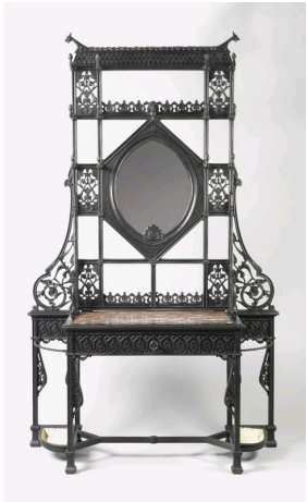
Christopher Dresser, Chaise en métal - vers 1875 Cooper Hewitt Design Museum