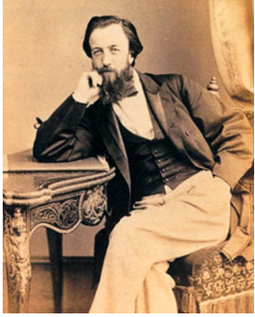
Portrait de Christopher Dresser.

Célèbre artiste britannique, Christopher Dresser (1834-1904) tient une place unique dans le paysage artistique de l'ère victorienne. Il comprend rapidement et avant tout le monde le rôle que l'industrie peut avoir dans la production artistique. Il cherche alors des collaborations avec les grands industriels britanniques de l'époque (notamment la Coalbrookdale Company) pour explorer l'aspect fonctionnel des objets et développer la géométrisation des ornements qu'il conçoit.