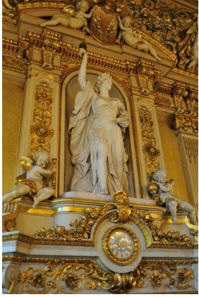
Salon de l'Horloge du Ministère des Affaires étrangères. Les bronzes de la cheminée et l'horloge sont de Victor Paillard.