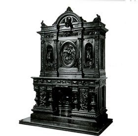
573. Egisto Gajani, stipite di noce intagliato, esibito all'esposizione di Parigi del 1878, Firenze 1877 ca., Già sala Pandolfini, Firenze.