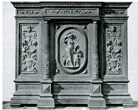
574 Egisto Gajani, stipo, legno di noce intagliato, Firenze 1876. Foto d'epoca.

Buffet bas par Egisto Gajani en noyer sculpté, 1876. Photo d'époque.