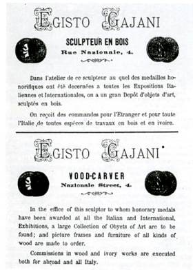
572. Annuncio pubblicitario di Egisto Gajani, in: Guida commerciale, artistica e scientifica della città di Firenze, Firenze 1873.