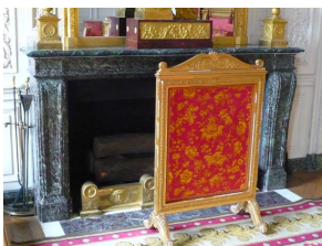
Vue d'une cheminée en Levanto au Grand Trianon de Versailles