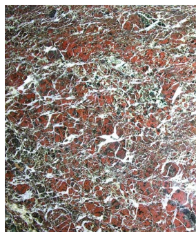
Echantillon de marbre Levanto Vert et Rouge

Le Levanto Vert et Rouge est une roche serpentinite plus qu'un marbre à proprement parler. Il s'agit d'un marbre rouge, plus ou moins mélangée de vert, et plus ou moins parsemé de veines blanches. L'aspect bréchiqque de cette roche et ses coloris sombres lui donnent beaucoup de caractère. Le début de l'exploitation du Levanto remonte au XII e siècle, époque à laquelle les carrières se trouvaient sur la côte Ligure, en Italie. Depuis, dix-neuf carrières ont été ouvertes dans cette région et ont fourni ce marbre. Aujourd'hui, il n'y a plus que deux carrières qui sont toujours en activité : San Giorgio et Rossola, sur la commune de Bonassola, dans l'Appennin Ligure, au sud-est de Gênes.