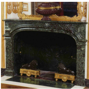
Grande cheminée en Levanto Vert et Rouge dans l'Antichambre des Chiens au Château de Versailles