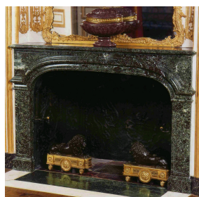
Grande cheminée en Levanto Vert et Rouge dans l'Antichambre des Chiens au Château de Versailles

On retrouve également ce marbre Levanto Vert et Rouge sur une grande cheminée Louis XVI conservée au Grand Trianon du Château de Versailles.