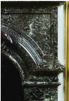
Détail de la cheminée de l'Antichambre des Chiens du Château de Versailles