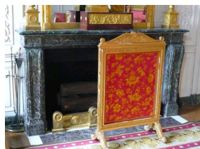
Vue d'une cheminée en Levanto au Grand Trianon de Versailles