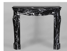
Photo n°11 : Petite cheminée Pompadour de style Louis XV en marbre Noir Marquina.