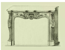
Photo n°7 : Cheminée aux trois coquilles. Dessin du XIXème siècle.