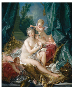
Photo n°6 : François Boucher (1703-1770), La Toilette de Venus, 1751.