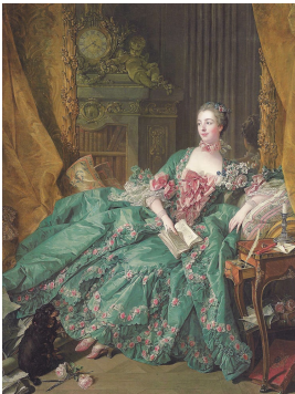
Photo n°2 : François Boucher (1703-1770), La marquise de Pompadour, 1756, Munich, Alte Pinakothek. La maîtresse du Roi pose aux côtés d'une table de BVRB, grand ébéniste du style Louis XV.