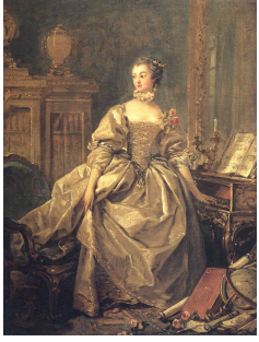
Photo n°12 : François Boucher (1703-1770), Madame de Pompadour, la main sur le clavier du clavecin, vers 1750, musée du Louvre, Paris. Entourée d'objets d'art de style Louis XV, la marquise apparaît comme une ambassadrice des arts.

Met, Nw York. Cette huile sur toile a été commandée pour le chateau de Bellevue, cadeau de Louis VX à sa Favorite. Bien que ce ne soit pas réellement un portrait, c'est une allusion évidente à la beauté de la Marquise de Pompadour.