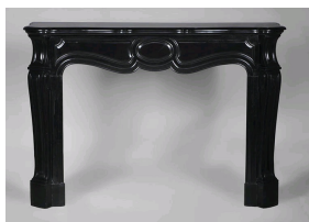
Photo n°3 : Grande cheminée Pompadour de style Louis XV en marbre Noir Fin de Belgique.