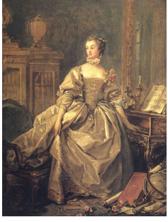
Photo n°12 : François Boucher (1703-1770), Madame de Pompadour, la main sur le clavier du clavecin, vers 1750, musée du Louvre, Paris. Entourée d'objets d'art de style Louis XV, la marquise apparaît comme une ambassadrice des arts.

Met, Nw York. Cette huile sur toile a été commandée pour le chateau de Bellevue, cadeau de Louis VX à sa Favorite. Bien que ce ne soit pas réellement un portrait, c'est une allusion évidente à la beauté de la Marquise de Pompadour.