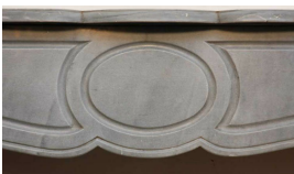
Photo n°5 : Cheminée Pompadour, marbre gris-bleuté – détail du bandeau sculpté du fameux cercle encadré de moulures oblongues.