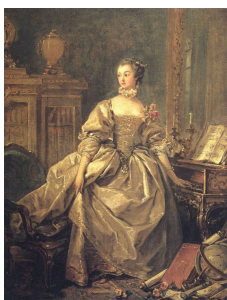
Photo n°12 : François Boucher (1703-1770), Madame de Pompadour, la main sur le clavier du clavecin, vers 1750, musée du Louvre, Paris. Entourée d'objets d'art de style Louis XV, la marquise apparaît comme une ambassadrice des arts.