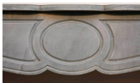
Photo n°5 : Cheminée Pompadour, marbre gris-bleuté - détail du bandeau sculpté du fameux cercle encadré de moulures oblongues.