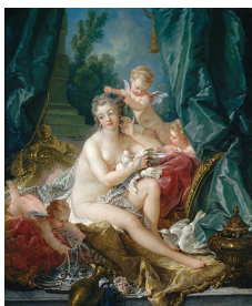
Photo n°6 : François Boucher (1703-1770), La Toilette de Venus, 1751, Met, Nw York. Cette huile sur toile a été commandée pour le chateau de Bellevue, cadeau de Louis VX à sa Favorite. Bien que ce ne soit pas réellement un portrait, c'est une allusion évidente à la beauté de la Marquise de Pompadour.