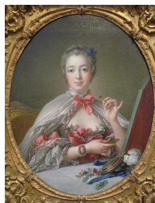
Photo n°9 : François Boucher (1703-1770), Madame de Pompadour à sa toilette, vers 1750. À son poignet un bracelet avec le profil de son protecteur, le roi Louis XV.