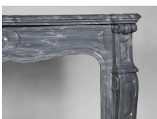
Photo n°13 : Cheminée ancienne de style Louis XV, modèle Pompadour, en marbre Bleu Turquin - détail du coin droit.