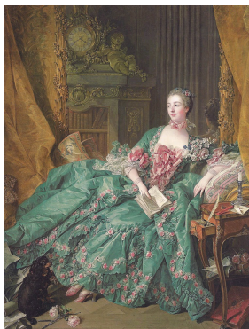
Photo n°2 : François Boucher (1703-1770), La marquise de Pompadour, 1756, Munich, Alte Pinakothek. La maîtresse du Roi pose aux côtés d'une table de BVRB, grand ébéniste du style Louis XV.