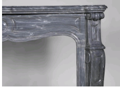
Photo n°13 : Cheminée ancienne de style Louis XV, modèle Pompadour, en marbre Bleu Turquin - détail du coin droit.

marbre Griotte rouge de Belgique, XIXe siècle - détail d'une bouche d'aération.