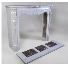
Photo n°8 : Cheminée ancienne de style Louis XV en marbre blanc veiné gris, se rapprochant du modèle Pompadour.