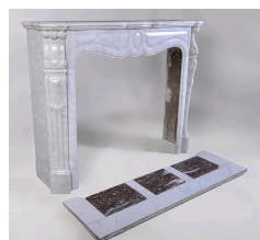
Photo n°8 : Cheminée ancienne de style Louis XV en marbre blanc veiné gris, se rapprochant du modèle Pompadour.