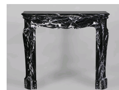
Photo n°11 : Petite cheminée Pompadour de style Louis XV en marbre Noir Marquina.