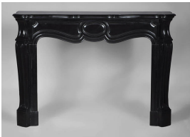
Photo n°3 : Grande cheminée Pompadour de style Louis XV en marbre Noir Fin de Belgique.