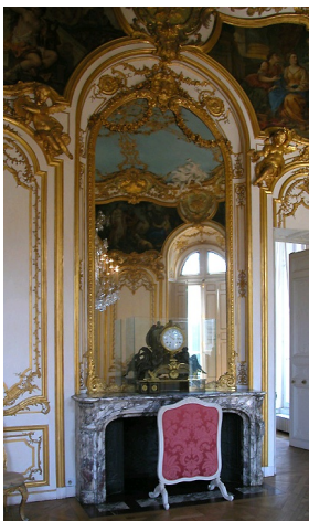
Grande cheminée Régence ornant le Salon Ovale de l'Hôtel de Soubise à Paris