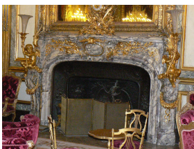
Exceptionnelle cheminée en marbre Fleur de Pêcheur avec putti en bronze

Le marbre Fleur de Pêcheur est un marbre historique, beaucoup utilisé au XIX e siècle pour des réalisations d'exception. Un des exemples les plus remarquables de réalisation avec ce marbre est l' extraordinaire cheminée du Grand Salon des appartements de Napoléon III au Musée du Louvre , ornée de bébés en bronze formant lumière.