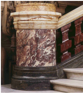
Fût de colonne en marbre Fleur de Pêcheur dans le Grand Escalier de l'Opéra Garnier à l'Opéra