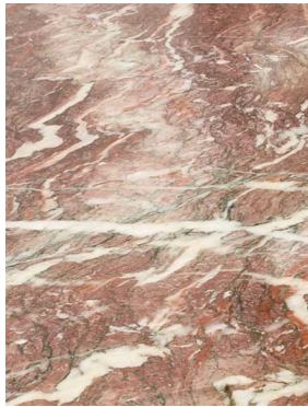
Echantillon de marbre Fleur de Pêcheur