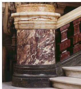
Fût de colonne en marbre Fleur de Pêcheur dans le Grand Escalier de l'Opéra Garnier à l'Opéra