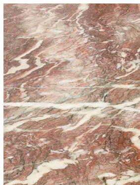
Echantillon de marbre Fleur de Pêcheur