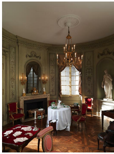
Boiseries attribuées à Barthélémy Cabirol, provenant d'un hôtel particulier sur le Cours d'Albert à Bordeaux, vers 1785, Metropolitan Museum of Arts, New York.