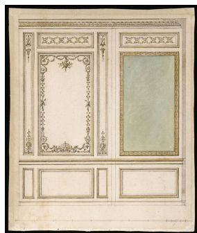
Jules-Hugues et Jean-Siméon Rousseau, Projet de boiseries pour le cabinet de la Méridienne de Marie-Antoinette, 1781, Château de Versailles.