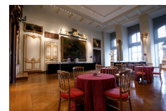
Salon des boiseries, musée des Arts Décoratifs, Paris.