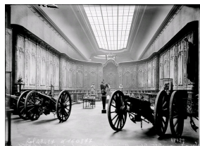
Boiseries de la cathédrale de Verdun exposées au Petit Palais en 1916, photographie de l'agence Rol.