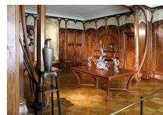
Alexandre Charpentier, Boiserie de salle à manger, 1900-1901, musée d'Orsay.