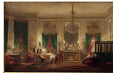
Sébastien Charles Giraud, Le Salon de la princesse Mathilde, rue de Courcelles, 1859, Musée de Compiègne.