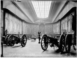
Boiseries de la cathédrale de Verdun exposées au Petit Palais en 1916, photographie de l'agence Rol.