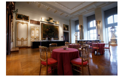
Salon des boiseries, musée des Arts Décoratifs, Paris.