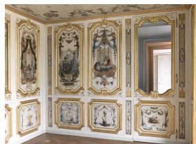
Boiseries de la Petite Singerie, par Christophe Huet, vers 1730, Château de Chantilly.