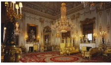
Buckingham Palace, décoration de 1762-1776, Londres.