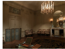
Boiseries de l'Hôtel Lauzun, vers 1770, restées sur place jusqu'au début du XXe siècle. Metropolitan Museum of Arts, New York.