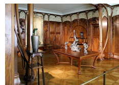
Alexandre Charpentier, Boiserie de salle à manger, 1900-1901, musée d'Orsay.