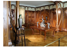
Alexandre Charpentier, Boiseries de salle à manger, 1900-1901, musée d'Orsay.