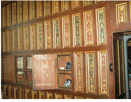
Cabinet de Catherine de Médicis, aménagé avant 1520, Château de Blois