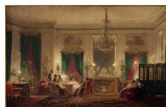
Sébastien Charles Giraud, Le Salon de la princesse Mathilde, rue de Courcelles, 1859, Musée de Compiègne.

Les pièces de boiseries forment un patrimoine varié auquel le musée des Arts Décoratifs rend hommage dans son Salon des Boiseries , une pièce de réception où sont exposées ces panneaux, colonnes et autres éléments, au même titre que des tableaux ou des sculptures.