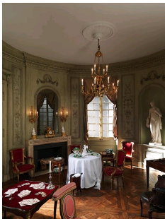
Boiseries attribuées à Barthélémy Cabirol, provenant d'un hôtel particulier sur le Cours d'Albert à Bordeaux, vers 1785, Metropolitan Museum of Arts, New York.