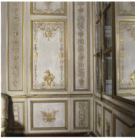
Boiseries du cabinet intérieur du Roi, par Jacques Verbeckt, 1753, Château de Versailles.