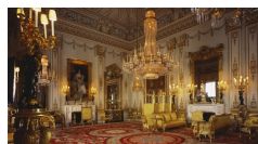
Buckingham Palace, décoration de 1762-1776, Londres.

Véritables éléments d' architecture intérieure , les pièces de boiseries ont été popularisées à la Renaissance pour les cabinets d'étude ou de curiosité. Le château de Blois est ainsi connu pour ses panneaux de boiseries recelant des niches dérobées. Un usage récurrent, puisqu'en 1792, on retrouve une « lettre secrète » de Marie-Antoinette dans les boiseries de ses appartements aux Tuileries...