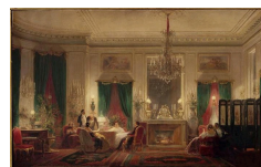
Sébastien Charles Giraud, Le Salon de la princesse Mathilde, rue de Courcelles, 1859, Musée de Compiègne.

Les pièces de boiseries forment un patrimoine varié auquel le musée des Arts Décoratifs rend hommage dans son Salon des Boiseries , une pièce de réception où sont exposées ces panneaux, colonnes et autres éléments, au même titre que des tableaux ou des sculptures.