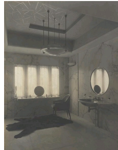
Salle de bain revêtue de marbre Paonazzo du Pavillon du Collectionneur, par Ruhlmann, à l'Exposition des Arts Décoratifs de Paris en 1925, Bibliothèque des Arts Décoratifs, Album du Pavillon du Collectionneur de J.E Ruhlmann.