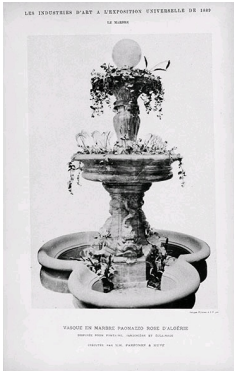
Vase en marbre Paonazzo, Parfony et Huvé, Exposition Universelle de 1889 à Paris.