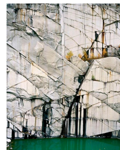
Carrière de marbre Paonazzo, Toscane, Italie.