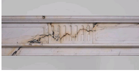
Cheminée en marbre Paonazzo, Galerie Marc Maison.

Le marbre Paonazzo tire son nom de ses veines sombres nimbées d'un halo où le mauve et le jaune rappellent la couleur mordorée des plumes de paon.