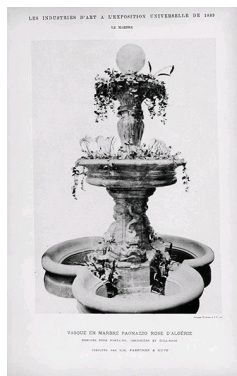
Vase en marbre Paonazzo, Parfony et Huvé, Exposition Universelle de 1889 à Paris.