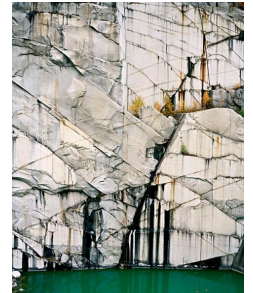
Carrière de marbre Paonazzo, Toscane, Italie.