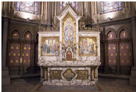
Autel de la chapelle Sainte Anne, Notre-Dame de Treilles, Lille, France.

Le marbre Paonazzo a ainsi traversé les styles, de l'Antiquité à l'Art Déco, et il reste aujourd'hui très apprécié pour la décoration intérieure.