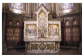
Autel de la chapelle Sainte Anne, Notre-Dame de Treilles, Lille, France.

Le marbre Paonazzo a ainsi traversé les styles, de l'Antiquité à l'Art Déco, et il reste aujourd'hui très apprécié pour la décoration intérieure.