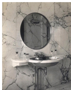
Salle de bain revêtue de marbre Paonazzo du Pavillon du Collectionneur, par Ruhlmann, à l'Exposition des Arts Décoratifs de Paris en 1925, Bibliothèque des Arts Décoratifs, Album Maciet.