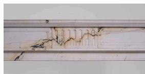
Cheminée en marbre Paonazzo, Galerie Marc Maison.

Le marbre Paonazzo tire son nom de ses veines sombres nimbées d'un halo où le mauve et le jaune rappellent la couleur mordorée des plumes de paon.