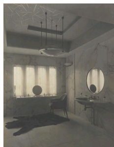
Salle de bain revêtue de marbre Paonazzo du Pavillon du Collectionneur, par Ruhlmann, à l'Exposition des Arts Décoratifs de Paris en 1925, Bibliothèque des Arts Décoratifs, Album du Pavillon du Collectionneur de J.E Ruhlmann.