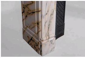
Cheminée en marbre Paonazzo, Galerie Marc Maison.

Enfin et surtout, c'est dans ce marbre que Ruhlmann revêt la salle de bain de son très célèbre Pavillon du Collectionneur , qui triompha à l' Exposition Internationale des Arts Décoratifs de 1925 à Paris .