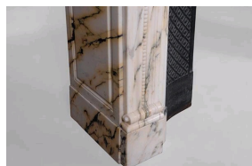
Cheminée en marbre Paonazzo, Galerie Marc Maison.

Enfin et surtout, c'est dans ce marbre que Ruhlmann revêt la salle de bain de son très célèbre Pavillon du Collectionneur , qui triompha à l' Exposition Internationale des Arts Décoratifs de 1925 à Paris .