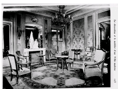
Salon de villa par Louis Sorel, avec une cheminée en Paonazzo, Art et Décoration, 1910.