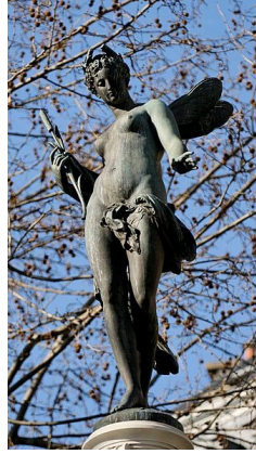
Nymphe fluviale de la fontaine du Théâtre-Français, 1874, rue Richelieu, Paris.