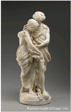
Daphnis et Chloé, Paris, Musée d'Orsay.