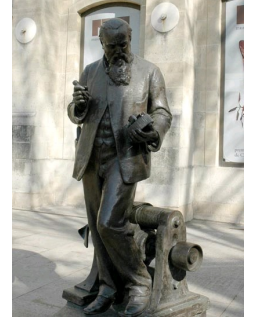
Zénobe Gramme, électricien, 1902, Paris, Musée des Arts et Métiers.