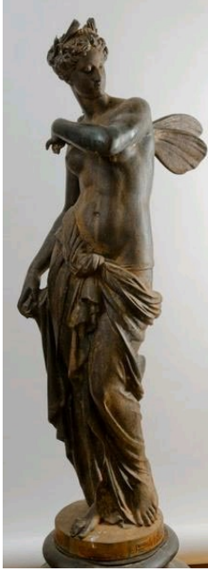
Néréide, Salon de 1870, fonte du Val d'Osne, Musée municipal de Saint-Dizier.