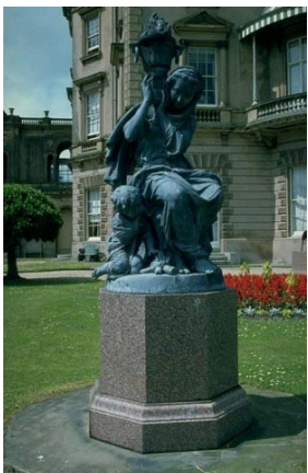
L'Hiver, offert à la Reine Victoria en 1855, Osborne House, The Royal Collection, Londres.