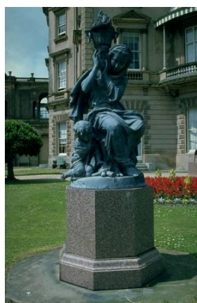
L'Hiver, offert à la Reine Victoria en 1855, Osborne House, The Royal Collection, Londres.