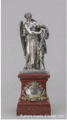
Modèle de Mathurin Moreau pour Christofle, « La Renommée inscrivant sur une tablette d'or la date de l'Exposition en 1866 », Paris, Musée d'Orsay.