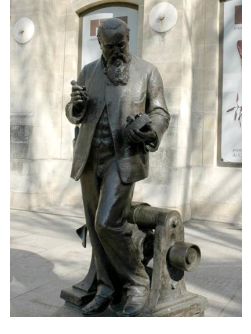
Zénobe Gramme, électricien, 1902, Paris, Musée des Arts et Métiers.