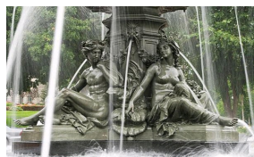
Fontaine de Tourny, Médaille d'or de l'Exposition Universelle de 1855, Parlement de Québec.