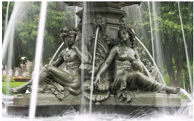
Fontaine de Tourny, Médaille d'or de l'Exposition Universelle de 1855, Parlement de Québec.