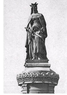
Marguerite d'Anjou, Salon de 1902.