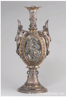
Christofle, Vase « The Education of Achilles », sculptures by Mathurin Moreau, 1867, Paris, Orsay Museum.