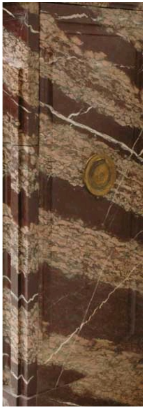
Détail de Campan Rubané