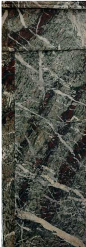
Détail de Campan Petit Mélange