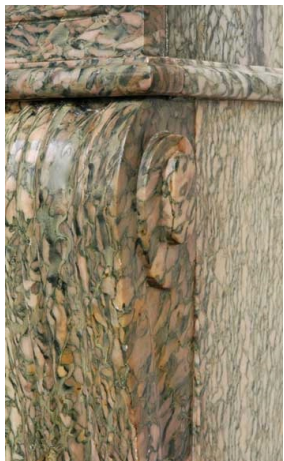
Détail de Campan Rose et Vert