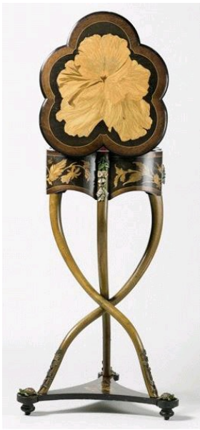
Charles Guillaume Diehl, Table à ouvrage, inscription « Souvenir de l'Exposition Universelle de 1878 », Musée d'Orsay, Paris.