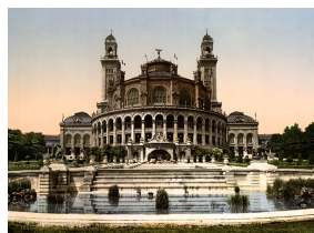
Le Palais du Trocadéro, photographie, Library of Congress, Washington.