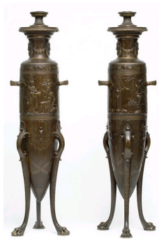
Barbedienne et Levillain, Paire de vases néo-grecs, Musée des Arts Décoratifs, Paris.