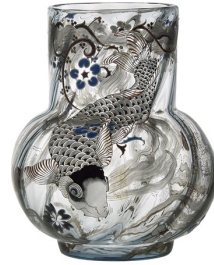
Emile Gallé, Vase « La Carpe », 1878, Musée des Arts Décoratifs, Paris.