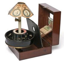
Emile Raynaud, Praxinoscope-Théâtre, 1878, Musée des Arts Décoratifs, Paris.