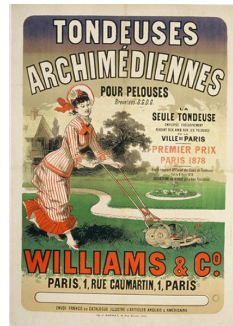
Jules Chéret, affiche pour les tondeuses archimédiennes Williams & Co., Musée des Arts Décoratifs, Paris.