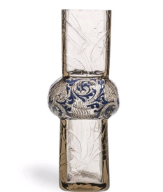
François-Eugène Rousseau, Vase bambou, 1878, Musée des Arts Décoratifs, Paris.