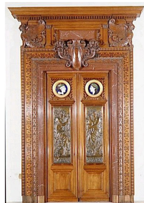
Porte monumentale de Fourdinois et Fossey, 1878, Musée d'Orsay, Paris.