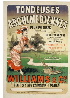
Jules Chéret, affiche pour les tondeuses archimédiennes Williams & Co., Musée des Arts Décoratifs, Paris.