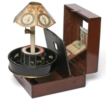
Emile Raynaud, Praxinoscope-Théâtre, 1878, Musée des Arts Décoratifs, Paris.