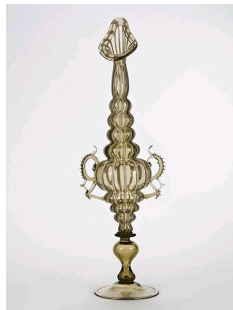
Verre de Murano Castellani, 1878, Musée des Arts Décoratifs, Paris.