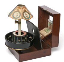
Emile Raynaud, Praxinoscope-Théâtre, 1878, Musée des Arts Décoratifs, Paris.