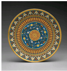
Plat de Minton, 1878, Metropolitan Museum of Arts, New-York.