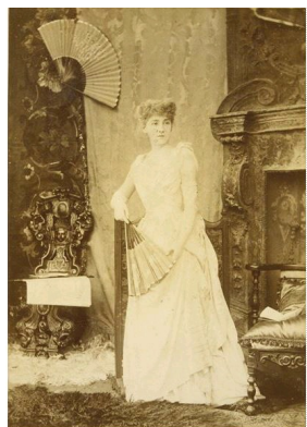
Paul Nadar, Portrait de jeune femme à l'Exposition universelle de 1878, 1878, Musée d'Orsay, Paris.