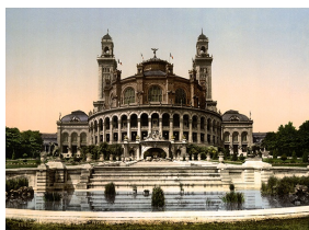
Le Palais du Trocadéro, photographie, Library of Congress, Washington.