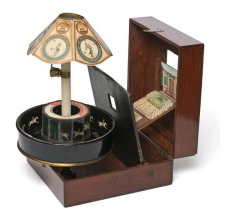
Emile Raynaud, Praxinoscope-Théâtre, 1878, Musée des Arts Décoratifs, Paris.