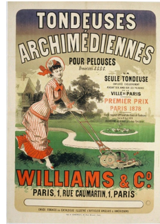
Jules Chéret, affiche pour les tondeuses archimédiennes Williams & Co., Musée des Arts Décoratifs, Paris.