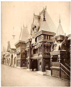
Pavillon de la Russie, réplique de la maison natale de Pierre le Grand.