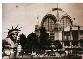
Le palais du Champs-de-Mars et la tête de la Statue de la Liberté, Exposition Universelle de 1878, Paris.

La Troisième République est proclamée en 1870, et une nouvelle Exposition Universelle est organisée à Paris pour présenter au monde le nouveau visage de la France. Le Palais du Trocadéro , réalisé par Gabriel Davioud et Jules Bourdais , est une impressionnante architecture iconique de l'Exposition.