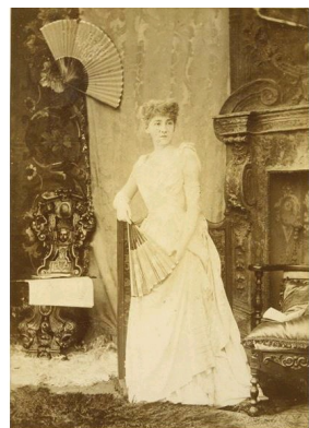
Paul Nadar, Portrait de jeune femme à l'Exposition universelle de 1878, 1878, Musée d'Orsay, Paris.