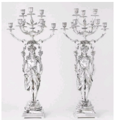
Carrier-Belleuse et Christofle & Cie, candélabres « Bacchus rieur », 1878, Musée des Arts Décoratifs, Paris.