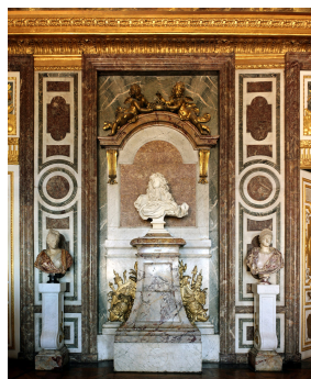
Le socle du buste de Louis XIV réalisé par Le Bernin est réalisé en Sarrancolin Ilhet.

Comme le Sarrancolin Fantastico, la variété de Sarrancolin Ilhet est extraite sur le village de Sarrancolin, dans les Hautes-Pyrénées. Les carrières connurent leur plus grande gloire sous le règne de Louis XIV, à tel point qu'à partir de 1692 elles furent considérées comme « carrière royale ». Les marbres de Sarrancolin présentent tous des motifs flammés de couleur rouge mais la variété de Sarrancolin Ilhet présente un faciès à dominante gris-marron.