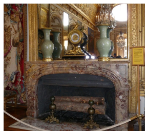
Grand cheminée Régence réalisée en Sarrancolin Ilhet dans l'antichambre à l'Oeil de Boeuf à Versailles.