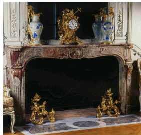
Superbe cheminée ancienne Louis XV réalisée en Sarrancolin Ilhet ornant le Salon d'Abondant du Musée du Louvre.