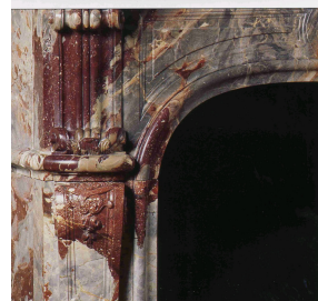
Détail de la cheminée du Salon d'Abondant du Louvre.