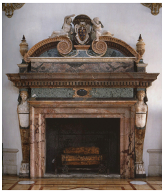
Exceptionnelle cheminée du Salon d'Hercule du Palazzo Farnèse.