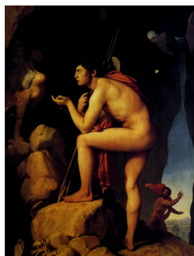
Oedipe et le Sphinx par Jean-Auguste-Dominique Ingres, 1808-1827. Huile sur toile. Musée du Louvre, Paris.

Le sphinx est une créature avec, le plus souvent, un buste d'homme ou de femme et un corps animal , généralement de lion mais parfois aussi de taureau ou de cheval . Cette créature mythologique est parfois représentée avec des ailes , des cornes de taureau ou encore une queue de serpent. On la trouve en Égypte dès le III ème millénaire avant notre ère, puis au Proche-Orient Ancien.