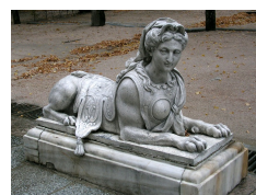
Sphinx ornant le Palais de la Granja, Espagne. Milieu du XVIII ème siècle. A la fin du XVII ème siècle, le sphinx devient un ornement de jardin très courant en Europe.