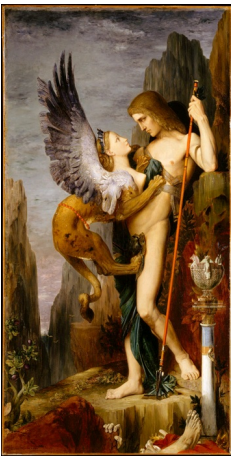
Œdipe et le Sphinx, Gustave Moreau, 1864, Huile sur toile. Metropolitan Museum of Art, New York City.