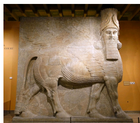
Lamassu provenant de Dur-Sharrukin, Période Néo-Assyrienne, vers 721-705 avt J.C. University of Chicago Oriental Institute, Chicago.