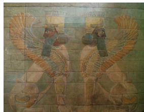
Sphinx affrontés, Palais de Darius à Suse, 522-486 av. J.-C., Musée du Louvre, Paris.