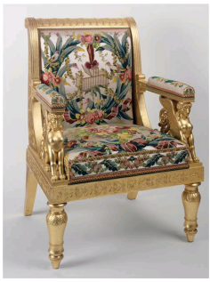
Fauteuil à sphinx d'apparat provenant de la chambre de la Reine, Château de Fontainebleau. XIX e siècle.