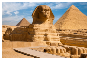
Le Grand Sphinx de Gizeh, Egypte, v. 2558-2532 av. J.-C.