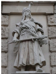
Magyar de la façade du Neue Burg, 1895-1901.