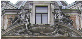
Tympan de la Villa Hermès, 1884.