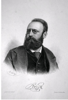
Rudolf Weyr

Académicien reconnu, Rudolf Weyr (1847-1914) est à Vienne l'un des représentants les plus actifs du courant néo-baroque et néo-rococo de la fin du XIXe et du début du XXe siècle. Remarqué par le couple impérial, il est l'auteur de nombreux monuments à Vienne et dans d'autres villes de l' Empire Austro-Hongrois . Son œuvre la plus connue est la fontaine Die Mach zur See , ou « Le Pouvoir sur la Mer », érigée en 1894 sur le Michaelertrakt devant le palais de Hofbourg . Cette fontaine représente la puissance maritime de l'Empire Austro-Hongrois, pendant du « Pouvoir sur la Terre », représentant les armées.