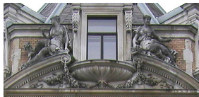
Tympan de la Villa Hermès, 1884.