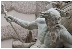
Détail du Pouvoir sur la Mer.