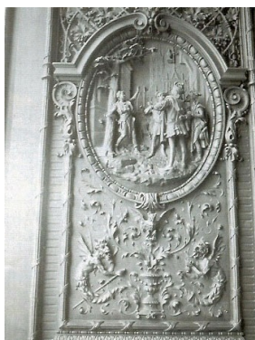
Bas-relief en bronze d'une des deux portes du Equitable Palais, 1890-1891.