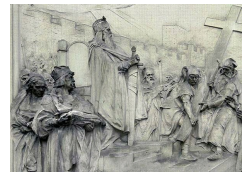
Bas relief illustrant la légende de la fondation de l'église Saint-Pierre de Vienne par Charlemagne, 1906.