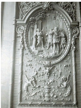
Bas-relief en bronze d'une des deux portes du Equitable Palais, 1890-1891.