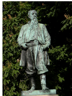
Monument à Hans Canon, Stadtpark, 1905.