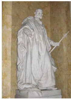
Statue de l'Empereur Franz Joseph Ier à Schwechat, 1898.