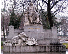
Monument à Johannes Brahms sur la Karlsplatz, 1908, Rudolf Weyr.