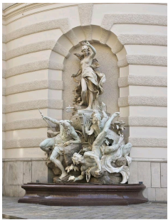
Le Pouvoir sur la Mer, 1895, place Michaelertrakt, Palais Hofburg, Vienne.