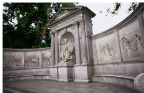
Monument Grillparzer, 1889.