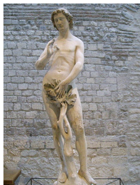
« Adam », statue ornant Notre-Dame de Paris et conservée aujourd'hui au Musée de Cluny.

Suivant le style Roman, le style Gothique embrasse une période vaste allant du XIIe au XVIe siècle .