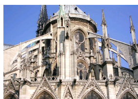
Arcs boutants extérieurs de la Cathédrale Notre-Dame de Paris construite à partir de 1163.