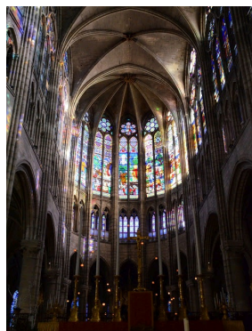
Intérieur de la Basilique de Saint-Denis construite par l'Abbé Suger à partir de 1135.