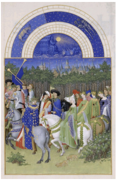
Une illustration des « Très Riches Heures du Duc de Berry ».