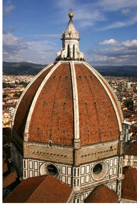
Dôme de l'église Santa Maria del Fiore par Brunelleschi.