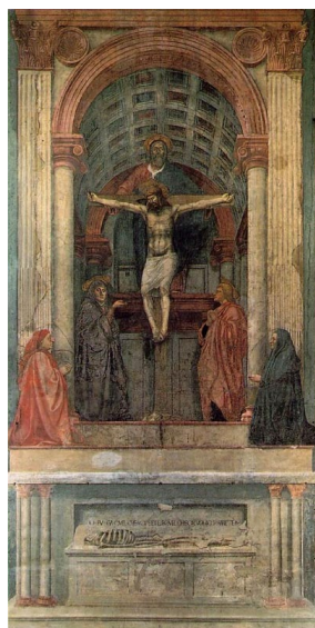
La Crucifixion de Masaccio.