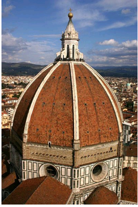
Dôme de l'église Santa Maria del Fiore par Brunelleschi.