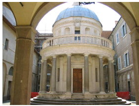
Le Tempietto de Bramante à Rome.