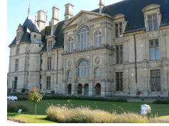
Le Château d'Ecouen