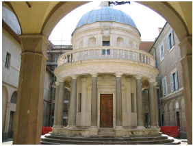
Le Tempietto de Bramante à Rome.