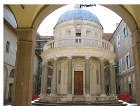
Le Tempietto de Bramante à Rome.