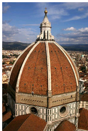
Dôme de l'église Santa Maria del Fiore par Brunelleschi.