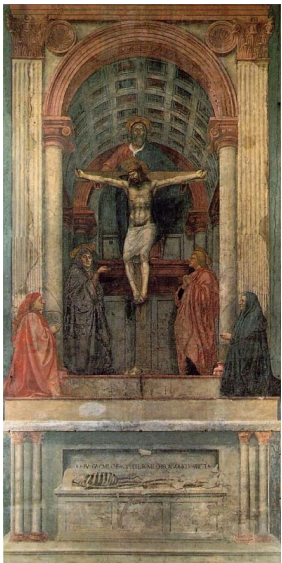
La Crucifixion de Masaccio.