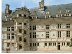
Le Château de Blois