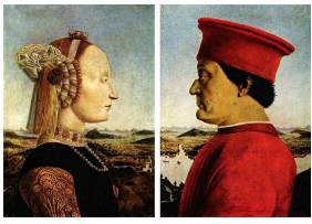
Les portraits du Duc d'Urbino et de sa femme par Piero Della Francesca.