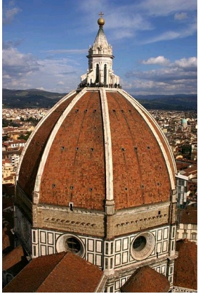
Dôme de l'église Santa Maria del Fiore par Brunelleschi.