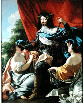
« LOUIS XIII ENTRE LA FRANCE ET LA NAVARRE », Simon Vouet, 2 e quart XVII e siècle, Musée du Louvre, Paris.