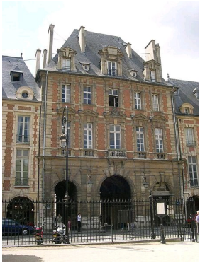
Pavillon du Roi sur la Place des Vosges à Paris, bâti en 1608.

Les bois massifs indigènes, le chêne et le noyer sont très employés. On commence à recourir à des bois d'importation tel l' ébène utilisé souvent en placage épais ; ou le gaïac antillais dont la texture se prête bien au tournage.