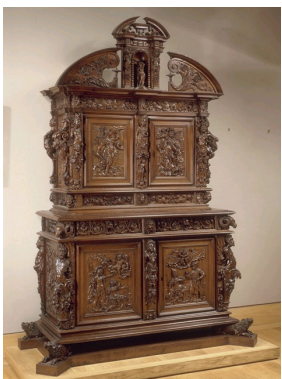
Armoire à deux corps de style Louis XIII en noyer, 1 er quart du XIII e siècle, Musée du Louvre, Paris.