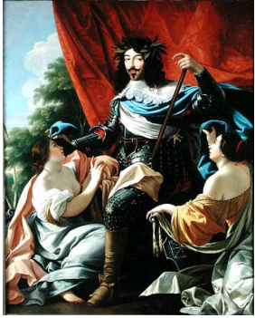
« LOUIS XIII ENTRE LA FRANCE ET LA NAVARRE », Simon Vouet, 2è quart XVIIè siècle, Musée du Louvre, Paris.