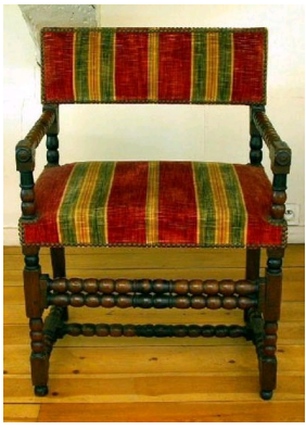
Chaise à bras de style Louis XIII, 1ère moitié du XVII e siècle, Musée des Arts Décoratifs de Bordeaux.