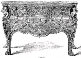
Commode attribuée à Caffieri. Faisait partie à l'origine de la collection du Hamilton Palace.