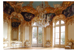
Salon ovale, Hôtel de Soubise. Germain Boffrand, architecte. Peintures de Charles-Joseph Natoire. 1735-1740.