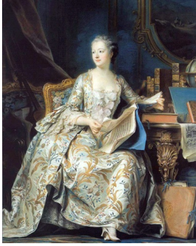
Portrait en pied de la Marquise de Pompadour, Maurice Quentin de La Tour. 1748-1755. Pastel. Musée du Louvre, Paris. INV27614.