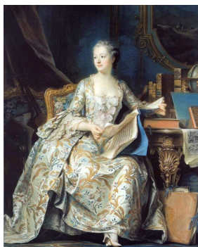
Portrait en pied de la Marquise de Pompadour, Maurice Quentin de La Tour. 1748-1755. Pastel. Musée du Louvre, Paris. INV27614.