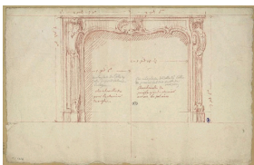
Projet de cheminée. Dessin. Nicolas Pineau. Vers 1730-1735. Musée des Arts Décoratifs, Paris. Inv. CD 1686.