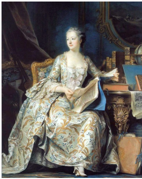
Portrait en pied de la Marquise de Pompadour, Maurice Quentin de La Tour. 1748-1755. Pastel. Musée du Louvre, Paris. INV27614.