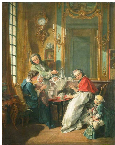
Le Déjeuner. François Boucher. 1739. Musée du Louvre, Paris. R.F. 926.