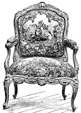
LOUIS XV. CARVED AND GILT "FAUTEUIL." Upholstered with Beauvais tapestry. Subjects from La Fontaine's Fables.