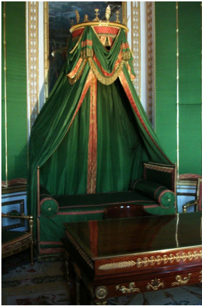
Chambre de l'empereur Napoléon Ier, château de Fontainebleau.