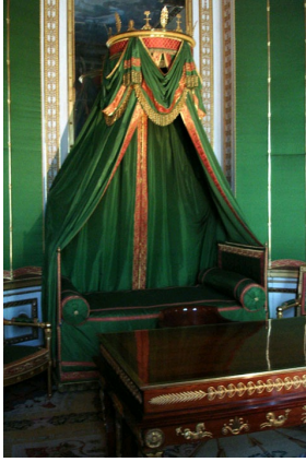
Chambre de l'empereur Napoléon Ier, château de Fontainebleau.

Lorsque Napoléon Bonaparte détient enfin les pleins pouvoirs (mai 1804), tous les éléments sont réunis pour que l'art connaisse une nouvelle impulsion, sous la houlette du nouveau régime. Afin de se légitimer, Napoléon Ier avait besoin de renouer avec le faste de l' Ancien Régime , mais sans en reprendre le style. On garda donc les références à l'Antique, en renforçant les connotations héroïques et guerrières, qui plaisaient tant à l'Empereur, et on renoua avec l'emploi de matériaux riches et coûteux , dont les marbres et les pierres dures (porphyre, malachite, lapis-lazuli) .