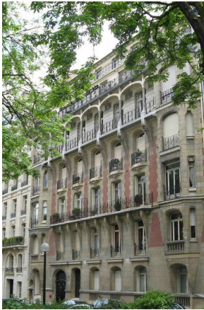
immeuble du 9 rue Le Tasse réalisé par l'architecte Louis Sorel.