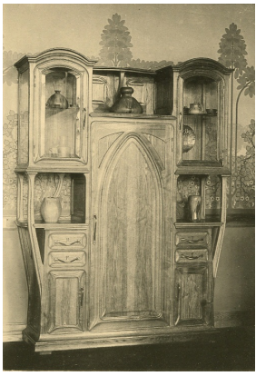
buffet de salle à manger, salon de la société nationale des Beaux-Arts de 1901.