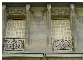
détail du premier étage.