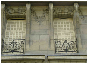
détail du premier étage.