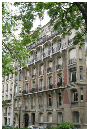
immeuble du 9 rue Le Tasse réalisé par l'architecte Louis Sorel.

Louis Sorel (1867-1933) accomplit ses études d'architecture à Paris auprès de Vaudemer, puis travailla avec Lecoecur. Sorel partie du groupe « L'Art dans tout », qui entre 1896 et 1901 se proposait - comme son nom l'indique -, de faire entrer l'art dans tous les domaines de la décoration intérieure.