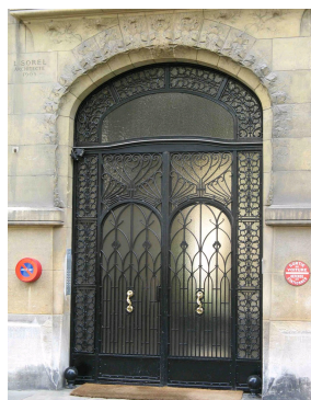
porte d'entrée de l'immeuble