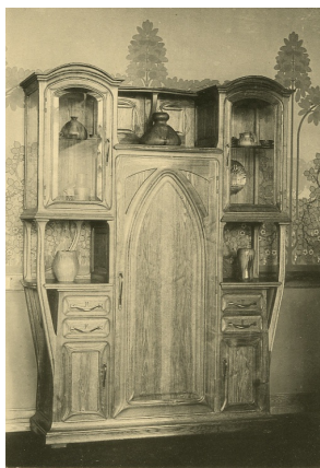
buffet de salle à manger, salon de la société nationale des Beaux-Arts de 1901.