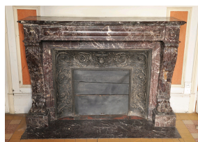
Cheminée ancienne de style Napoléon III réalisée en marbre Levanto Rouge au XIX e siècle