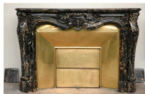
Très belle cheminée de style Louis XV en marbre Portor.