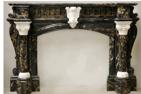
Exceptionnelle cheminée de style Napoléon III en marbre Portor et Carrare Statuaire.

Dans son Dictionnaire du commerce et de l'industrie , Blanqui décrit ainsi le marbre Portor : « Le fond de ce marbre est noir et les veines d'un jaune doré, ce qui lui a fait donner le nom de Portor (porte or). Il doit être classé parmi les marbres les plus riches, et cependant il n'est véritablement estimé et recherché que lorsque la qualité ne laisse rien à désirer. Le Portor nous vient du golfe de la Spezia (Golfe de Gênes) ».