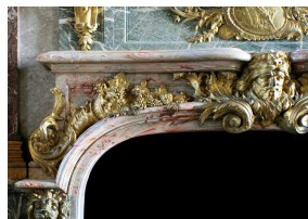
Détail de la cheminée en marbre Sarrancolin Fantastico sculptée par François Antoine Vassé (1681-1736) pour le Salon d'Hercules à Versailles.

A toutes les époques, on utilisait les marbres de Sarrancolin pour les sols , les revêtements muraux, les cheminées anciennes et le mobillier .