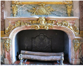
Exceptionnelle cheminée ancienne ornant le Salon d'Hercule du Château de Versailles réalisée en marbre Sarrancolin Fantastico et bronze.

120, rue des rosiers 93400 Saint Ouen (France) tel: +33.(0)6.60.62.61.90 contact@marcmaison.com