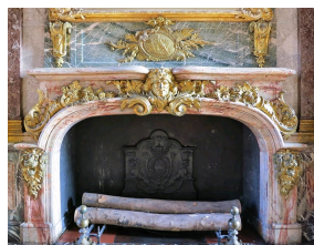
Exceptionnelle cheminée ancienne ornant le Salon d'Hercule du Château de Versailles réalisée en marbre Sarrancolin Fantastico et bronze.

Tout comme à Campan, on extrait sur la commune de Sarrancolin , un petit village des Hautes-Pyrénées, plusieurs variétés de marbres depuis le Moyen Âge. Les carrières connurent leur plus grande gloire sous le règne de Louis XIV , à tel point qu'à partir de 1692 elles furent considérées comme « carrière royale ». Les marbres de Sarrancolin présentent tous des motifs flammés de couleur rouge mais variété de Sarrancolin Fantastico présente un faciès à dominante rose-beige.