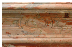
Élégante cheminée de style Régence en marbre Sarrancolin Fantastico (Detail of the front).